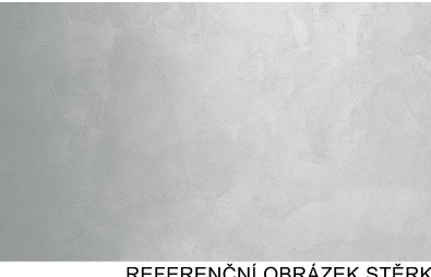
REFERENČNÍ OBRÁZEK STĚRKY